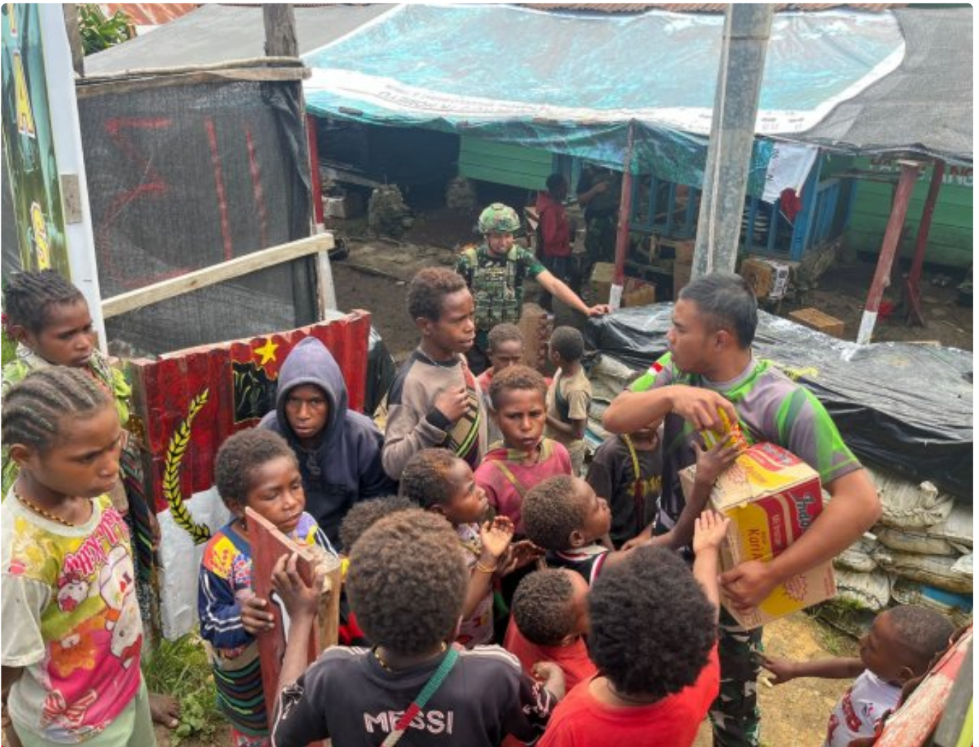
Personel Satgas Pamantas RI-PNG Mobile Yonif 113/Jaya Sakti berbagi bingkisan makanan ringan untuk anak-anak Kampung Pogapa, Distrik Homeyo, Kabupaten Intan Jaya, Papua Tengah. Pada Rabu (18/2/2026)

INTAN JAYA- Di tengah hamparan alam Intan Jaya, Papua Tengah, personel Satgas Pamantas RI-PNG Mobile Yonif 113/Jaya Sakti tak henti-hentinya menebar kebaikan. Pada Rabu (18/2/2026) lalu, Pos Pogapa menjadi saksi bisu momen hangat ketika para prajurit TNI Angkatan Darat ini berbagi keceriaan melalui bingkisan makanan ringan untuk anak-anak Kampung Pogapa, Distrik Homeyo.