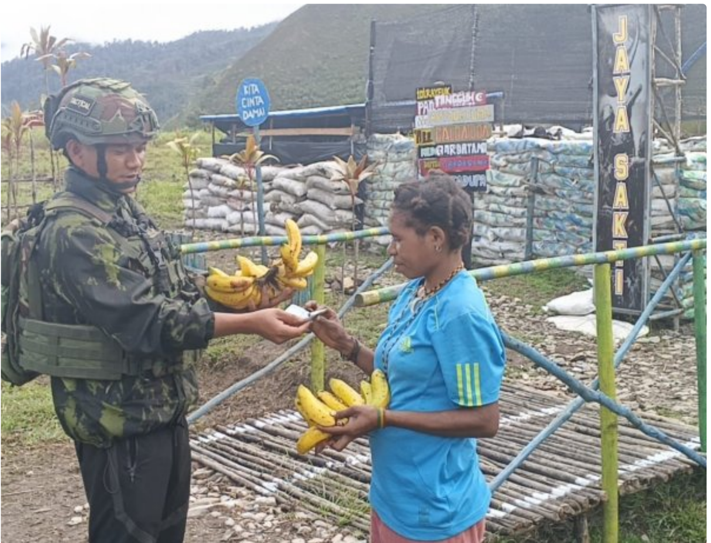
Foto: Prajurit Satgas Pamtas RI-PNG Mobile Yonif 113/Jaya Sakti (JS) Pos Bilai kembali menggelar program Borong Hasil Tani (Bohati) di Kampung Engganengga, Distrik Homeyo, Kabupaten Intan Jaya, Papua Tengah, Jumat (20/2/2026).

INTAN JAYA- Satgas Pamtas RI-PNG Mobile Yonif 113/Jaya Sakti (JS) Pos Bilai kembali menggelar program Borong Hasil Tani (Bohati) sebagai upaya mendukung perekonomian masyarakat pedalaman di Kampung Engganengga, Distrik Homeyo, Kabupaten Intan Jaya, Papua Tengah, Jumat (20/2/2026).