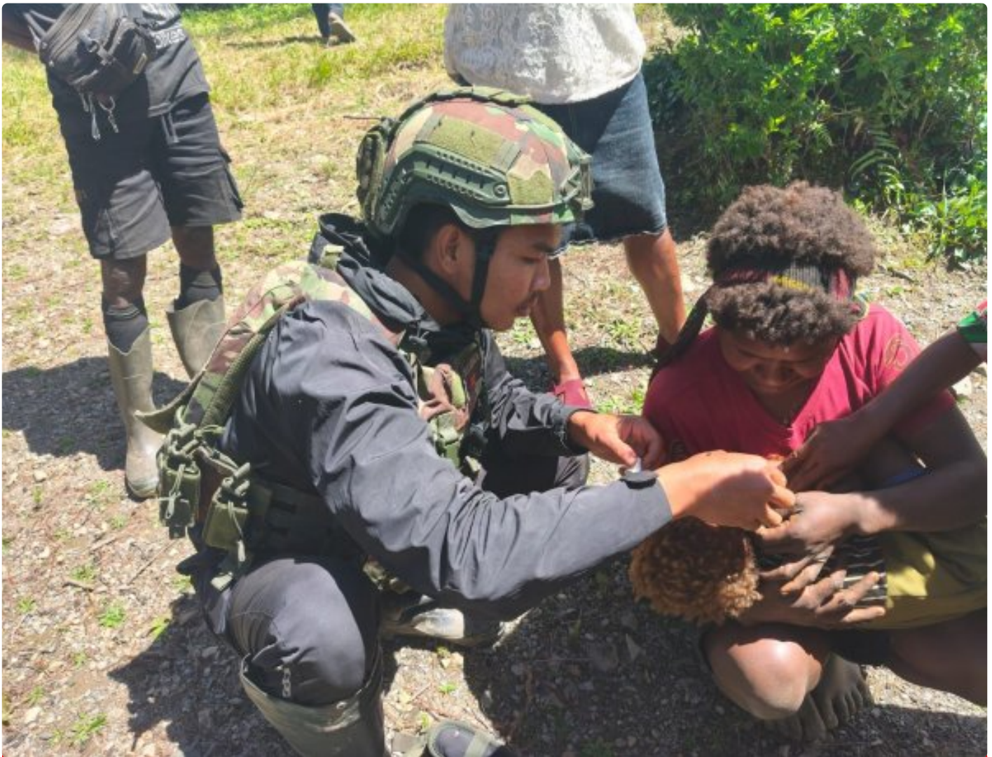
Foto: Prajurit TNI Satgas Pamtas RI-PNG Mobile Yonif 113/Jaya Sakti (JS) Pos Maya menghadirkan pelayanan kesehatan secara door to door di Kampung Ogeapa, Distrik Homeyo, Kabupaten Intan Jaya, Jumat (20/2/2026).

INTAN JAYA- Akses layanan kesehatan yang terbatas di wilayah pedalaman Papua Tengah mendorong Satgas Pamtas RI-PNG Mobile Yonif 113/Jaya Sakti (JS) Pos Maya menghadirkan pelayanan kesehatan secara door to door di Kampung Ogeapa, Distrik Homeyo, Kabupaten Intan Jaya, Jumat (20/2/2026).